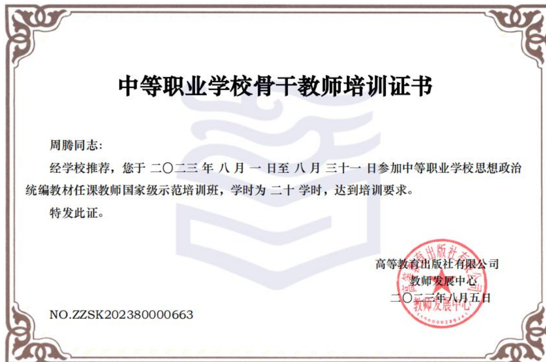
图8 思政教师参与培训证书

中国从“站起来”“富起来”到“强起来”的历史发展逻辑，坚定对中国革命、改革和建设的历史自信、现实自信和未来自信。