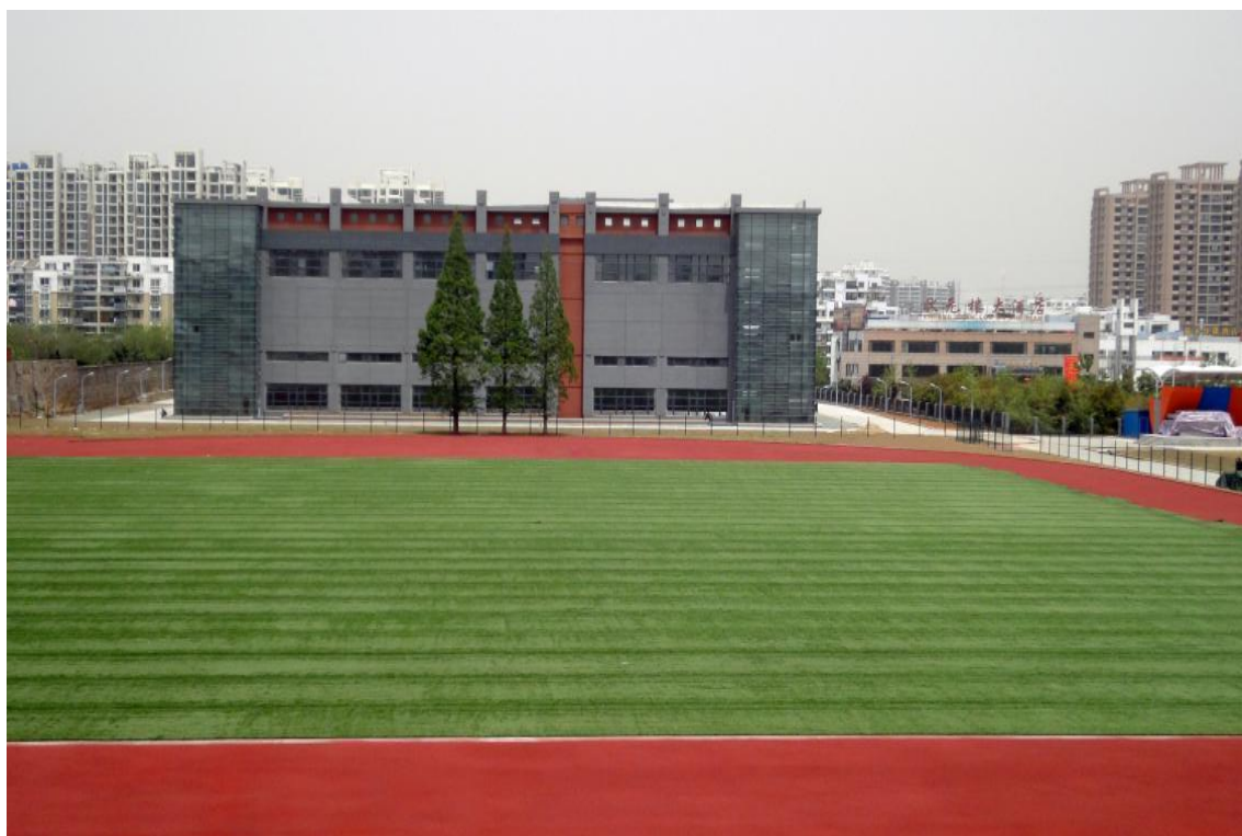
图 1 合肥体育运动学校田径场

2002 年经安徽省教育厅批准在合肥市体育中学基础上成立合肥体育运动学校，为普通中专学校，办学规模为 640 人。学校教学训练设施设备齐全，办学经验丰富，师资力量雄厚，训练、教学水平在全省名列前茅。