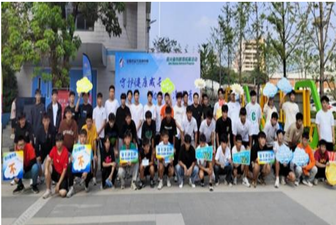
图 29 反兴奋剂签约现场

为了落实“零容忍、零出现”的反兴奋剂工作要求，全面推进反兴奋剂教育工作，进一步增强全体运动员反兴奋剂意识，2023年9月17日上午合肥市学青会暨2023年反兴奋剂教育拓展活动在合肥体育运动学校隆重举行。本次活动共有300多名运动员、教练员及辅助人员参加。