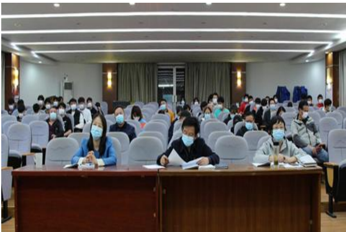
图 28 学习二十大活动现场

为掀起学习贯彻党的二十大精神热潮，营造真学深信笃行习近平新时代中国特色社会主义思想的浓厚氛围，11月2日晚，中共合肥体育运动学校党支部举行主题党日活动，集中观看清华大学继续教育学院开展的主题为《深入学习贯彻党的二十大精神》的线上直播课程。学习活动由陈瑛同志主持，除居家办公的同志在家自学外，全体留校党员干部、教职工与团员代表参加本次学习。