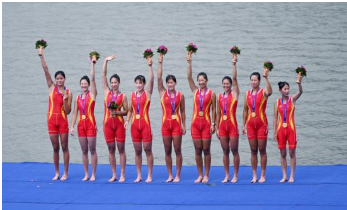
图 10 学校运动员参加 2023 年杭州亚运会赛艇比赛获得金牌

为规范学校师生参加各级各类技能大赛的竞赛管理，确保参赛工作平稳有序进行，学校特制订组织参加省级比赛工作方案，成立工作领导小组，做好各部门的协调统一，为技能大赛的持续发力提供坚实的组织和制度保障。学生专业能力不断增强，学生的专业理论和专业技能都得到提高，对学生毕业之后就业、升入高校有显著作用。