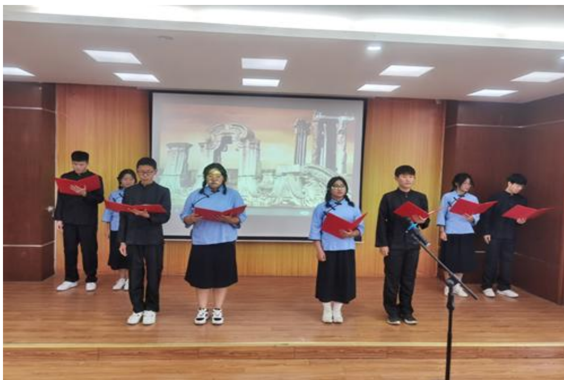
图 13 朗诵比赛精彩瞬间

本次比赛共有14个班级组队参赛，同学们用一首首饱含深情的诗篇，歌颂对党、对祖国的无限热爱。