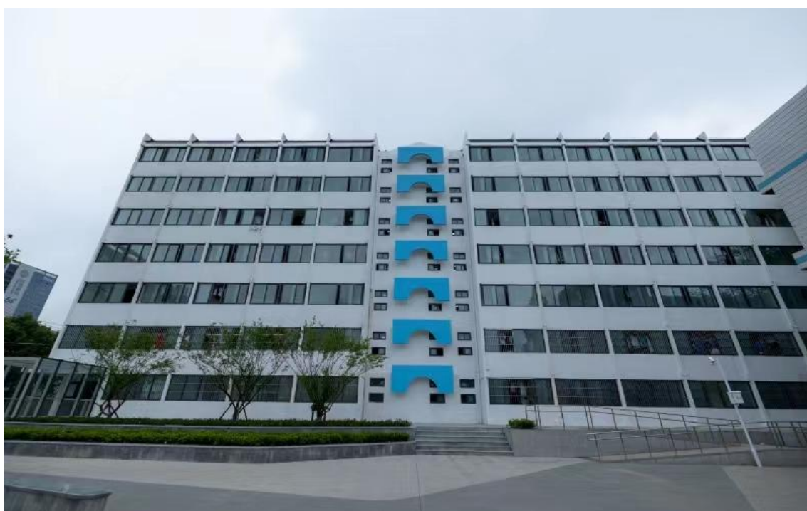
图 4 升级改造后崭新的学生公寓

信息化软、硬件设施建设进一步完善，新建智慧教室、心理咨询室、广播站等，学习环境、住宿环境及训练环境得到极大改善，整体校园环境优美，学生、家长及教师对学校办学的满意度不断提升。