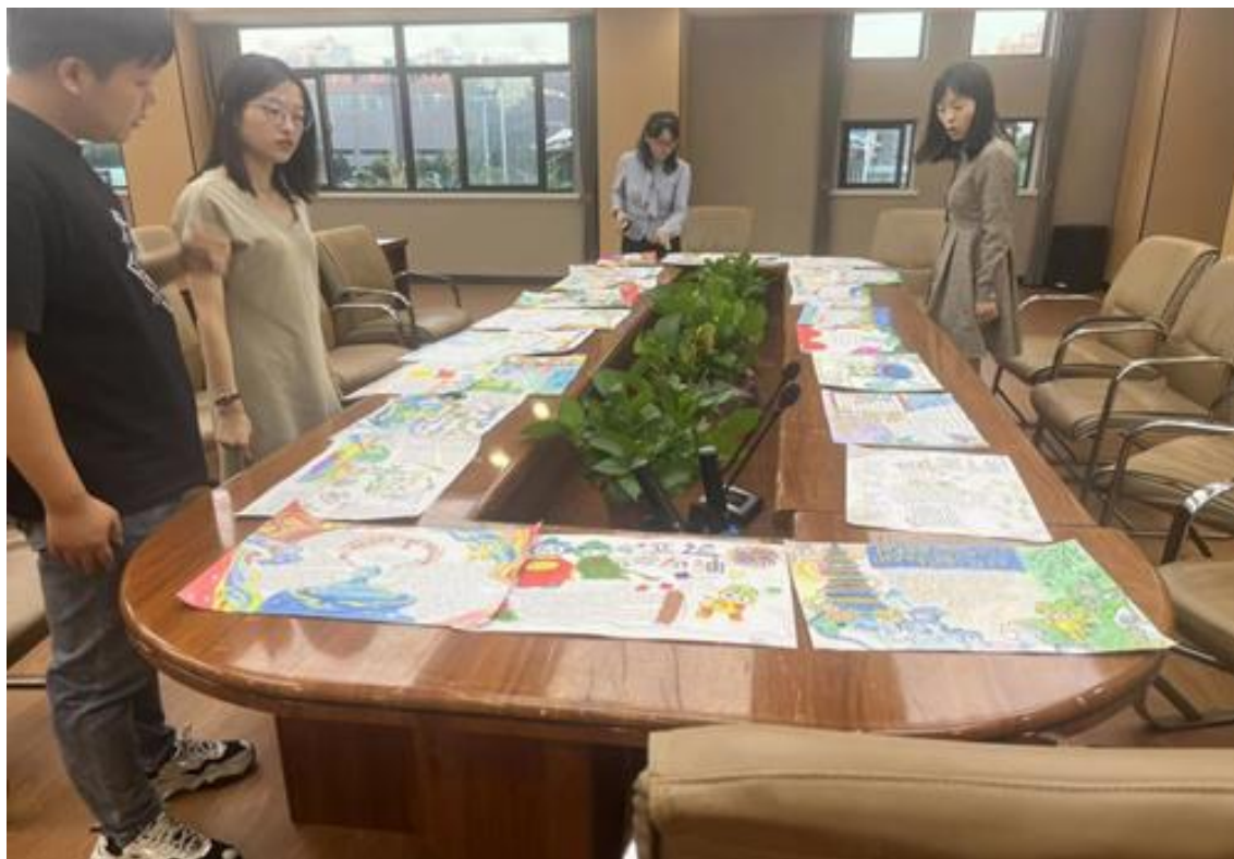
图 18 英语手抄报比赛

为倡导全民健身和弘扬亚运会精神，同时也为了丰富合肥体育运动学校学生们的校园文化生活，形成浓厚的校园艺术氛围，增强同学们的审美能力和艺术创造思维，合肥体育运动学校英语教研组开展了以“heart to heart”为主题的庆亚运手抄报比赛。