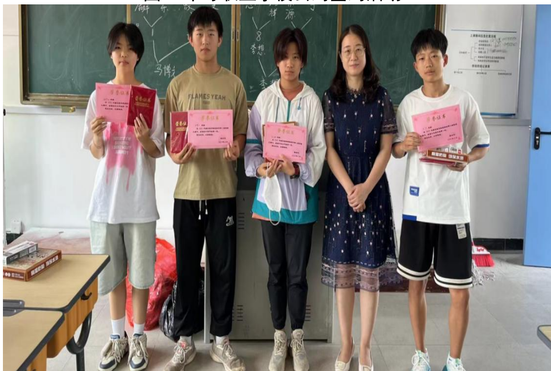
图 7 合肥体育运动学校第二届象棋比赛