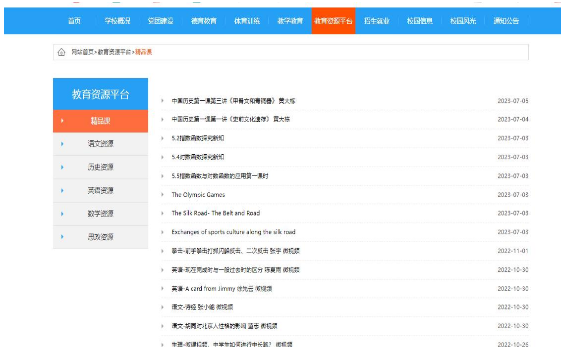
图 14 学校网站教学资源

学校教学管理部门依据国家课程标准和教育部门的要求，制定明确的教学目标，明确授课内容、学习目标和评价要求，将课程目标细分为具体的知识、技能和态度要求，以便教师在教学过程中能够清楚地指导学生的学习，制定合理的课程长度和学时分配，确保学习内容的充实、深入。