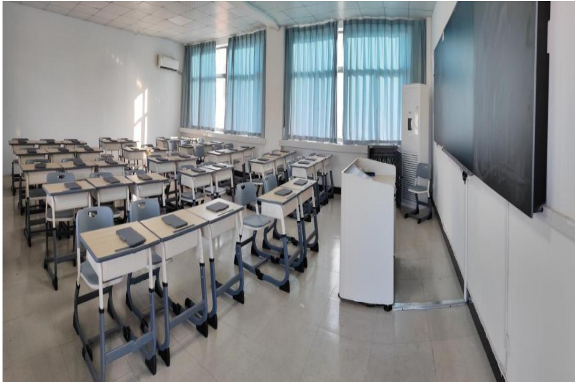
图 17 合肥体育运动学校智慧教室