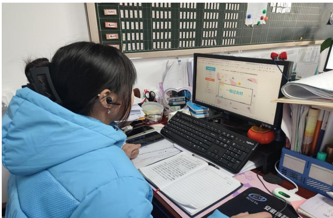
图 15 学生学习网络课程资源