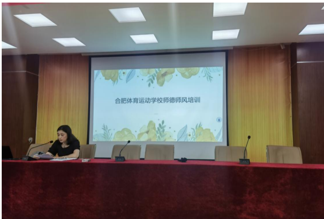
图 16 合肥体育运动学校开展师德师风培训