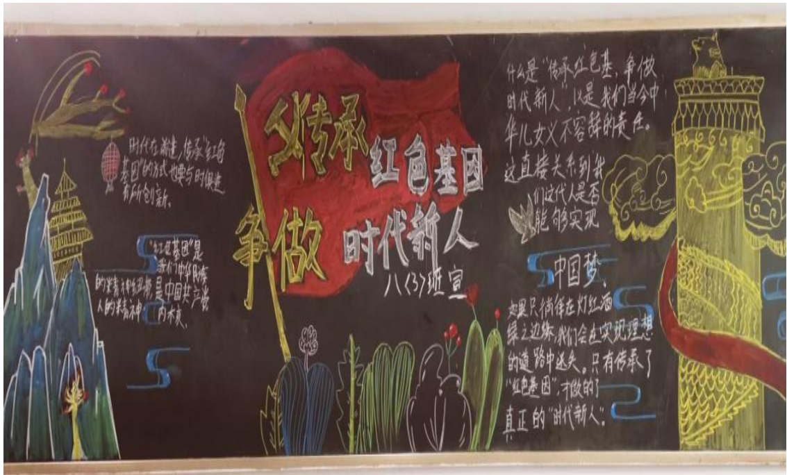
图 5 缅怀先烈黑板报