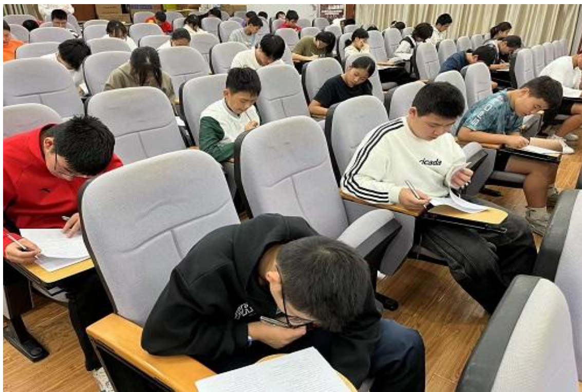
图 22 四史比赛活动现场

比赛开始，老师宣读竞赛规则，并向各位同学分发竞赛试卷与答题中性笔。试卷一共四十题，三十道单选题，十道多选题，考察了同学们对“四史”的理论基础和知识储备的扎实程度。竞赛期间，同学们积极思考，奋笔疾书，认真作答。