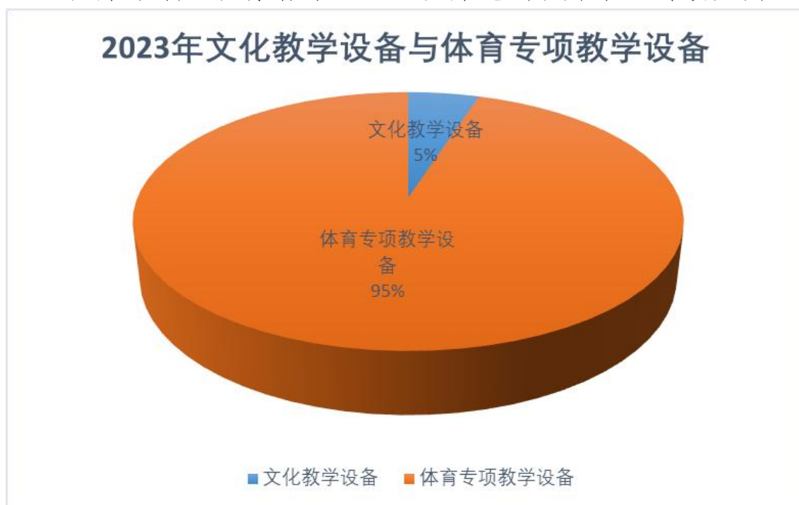
图 27 2023 年文化教学设备与体育专项教学设备

近两年体育专项教学设备购置主要为学生移动终端设备，多媒体教学设备，心理健康设备。学校不仅注重学生文化与体育成绩，也时刻关注学生心理健康，2023年建设学生心理健康活动室，聘请专业心理健康老师，为学生舒缓压力。