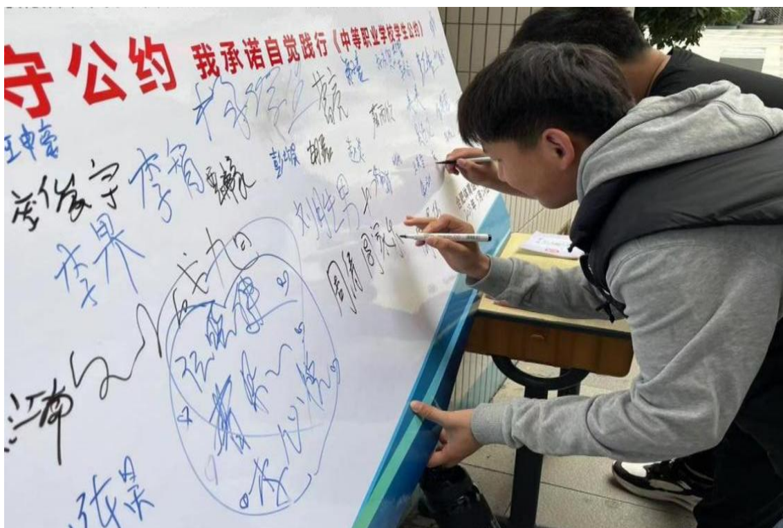
图 6 中等职业学校公约签约活动