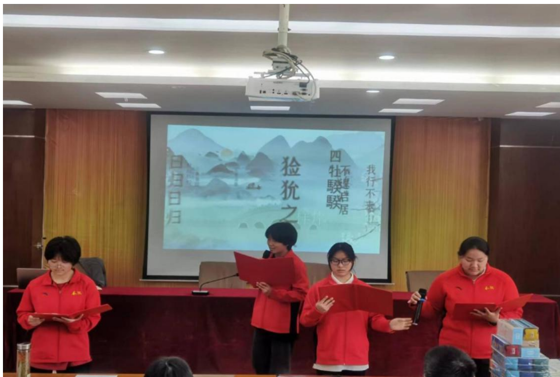
图 20 经典诵读展示活动

二、开展国学经典诵读活动。利用每天晨读十分钟时间进行国学经典朗诵，并借助节目活动的形式让学生感受文化、热爱经典。2023年6月学校开展了经典诵读展示活动，让传统文化潜移默化地融入校园艺术生活中。