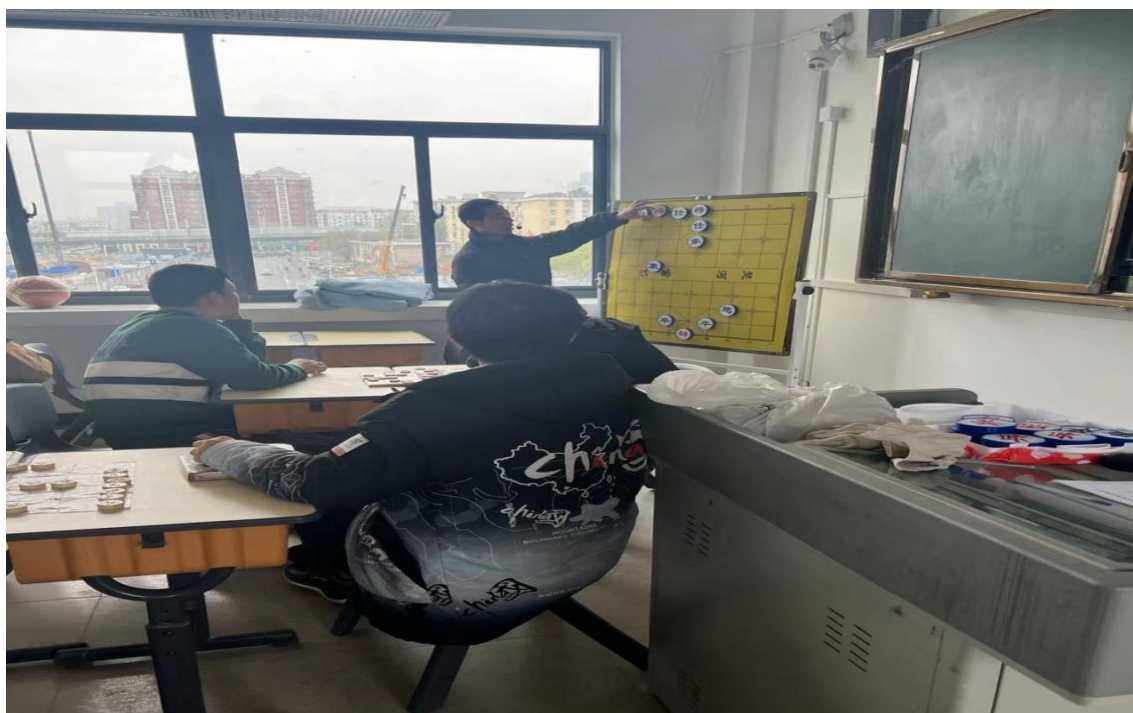
图 21 学校开设象棋课程

五、开设特色课程，弘扬传统文化。 学校以社团活动形式开设了象棋课程，以弘扬传统文化、促进学生全面发展为目的，充分发挥学校资源优势，挖潜增效、提质升级，增强学校育人和服务能力。