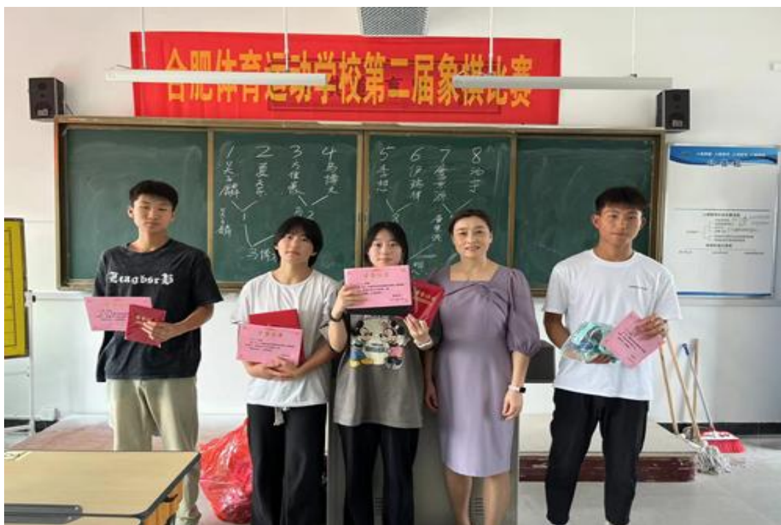
图 23 象棋比赛颁奖

本次比赛分成初中部组和中专部组，比赛分小组赛和决赛两个阶段，小组赛实行淘汰赛。经过一系列“厮杀”，男子组最终有四名选手、女子组有三名选手进入决赛。