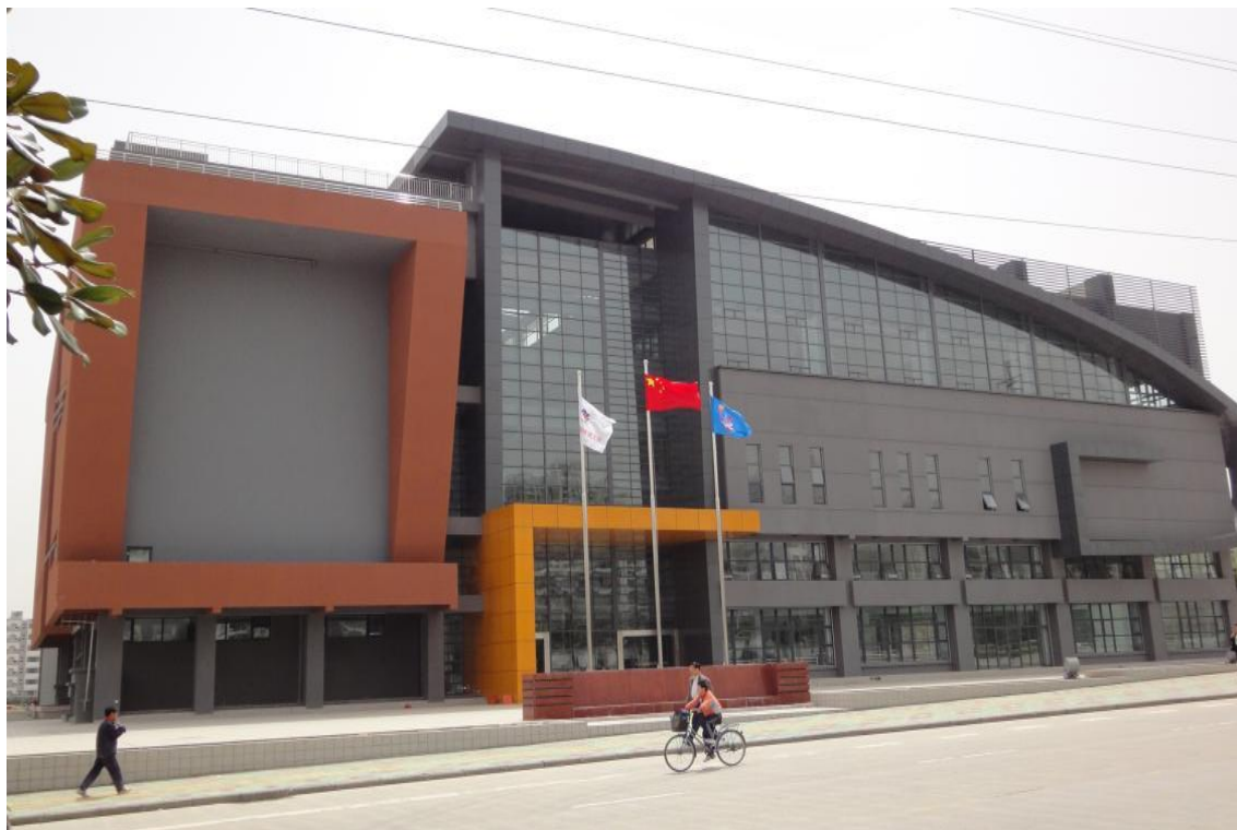
图 2 合肥体育运动学校训练馆

击、射击、柔道、跆拳道、摔跤、赛艇、皮划艇、足球、空手道、攀岩、羽毛球、举重、射箭等。截止 2023 年 8 月，学校固定资产原值 10989.51 万元人民币。较 2022 年，学校软件、硬件水平均有所提高。