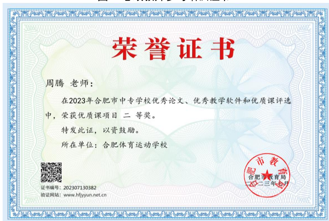
图9 思政教师参加优质课比赛获奖证书