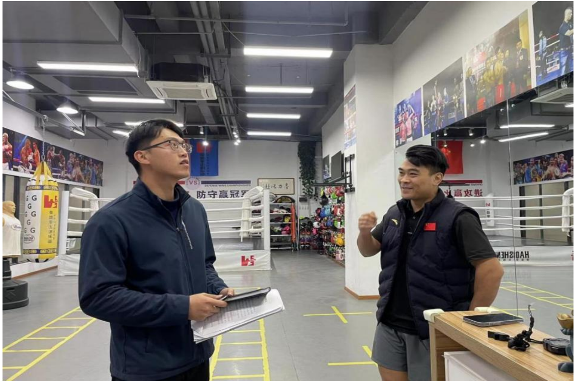
图 11 进行校外实习实训基地建设考察